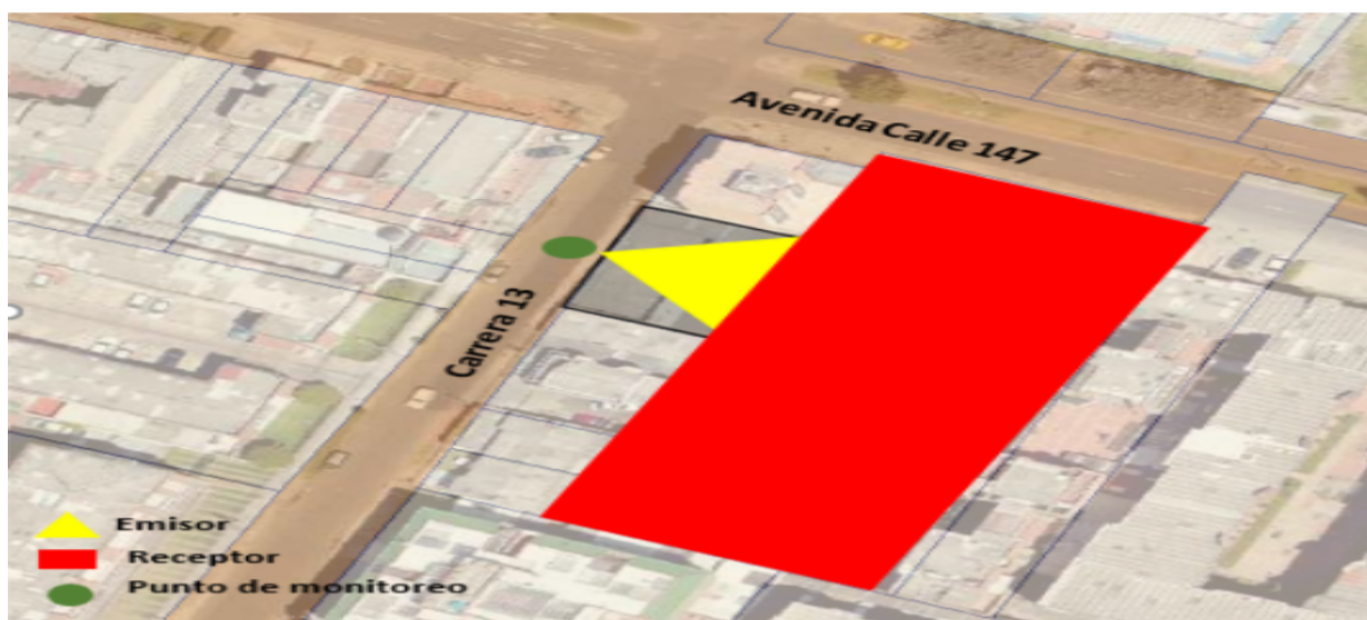
Figura 1. Ubicación del predio emisor, receptor (Avenida Calle 147 No. 12 – 95) y punto de medición.